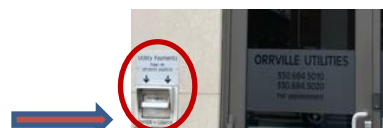
Buzón de utilidades de Orrville en 125 W. Water Street